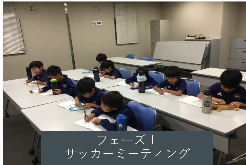
フェーズⅠ サッカーミーティング