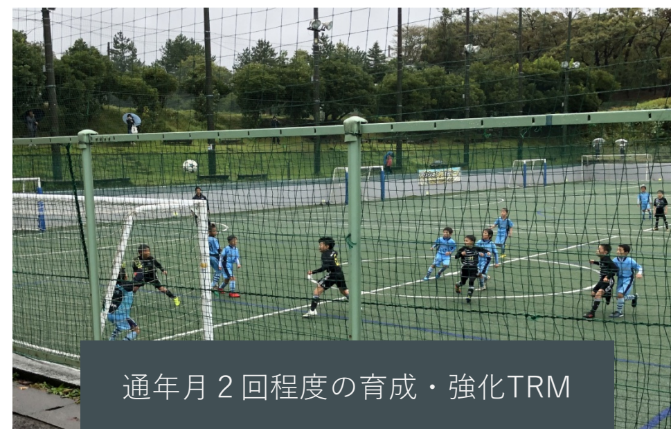
通年月2回程度の育成・強化TRM