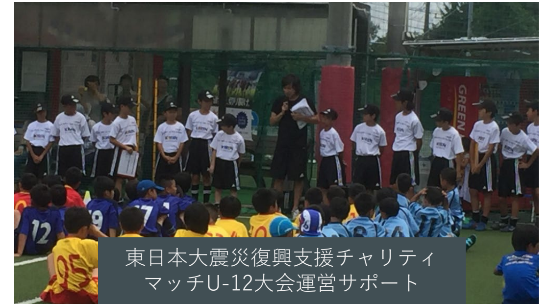
東日本大震災復興支援チャリティ マッチU-12大会運営サポート