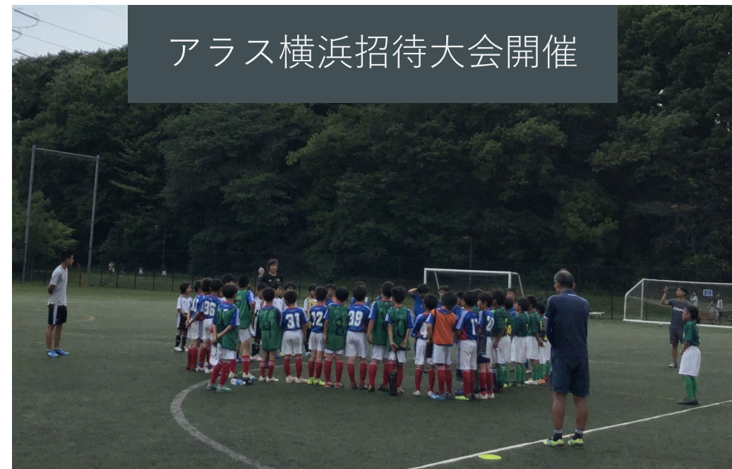
アラス横浜招待大会開催