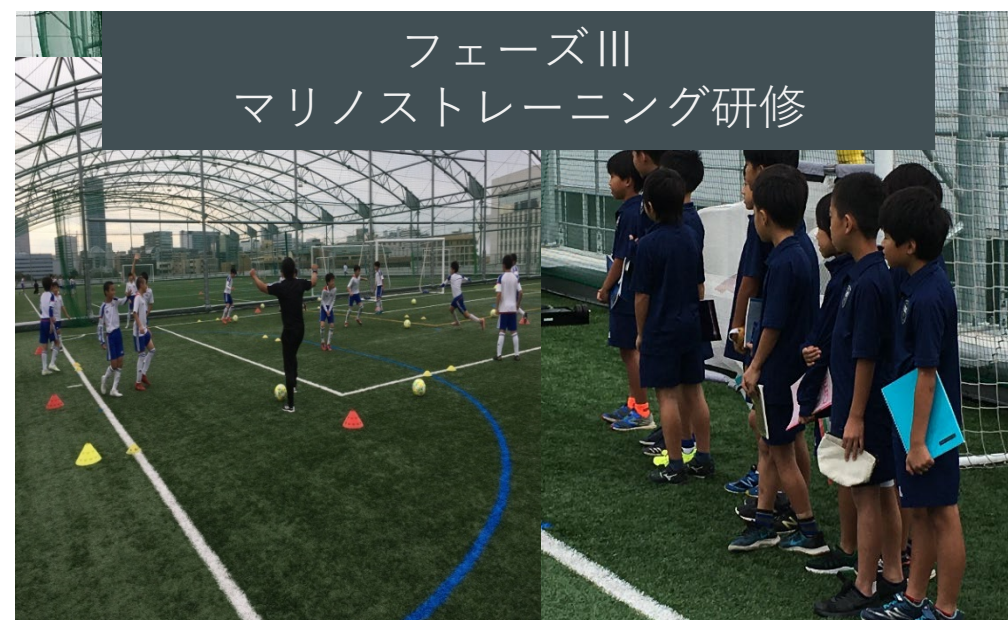
フェーズⅢ マリノストレーニング研修

2021JFAU-12リーグかもめグループ／プレミアU-11リーグ2019年8月夏合宿大会3位 2020年11月招待大会優勝